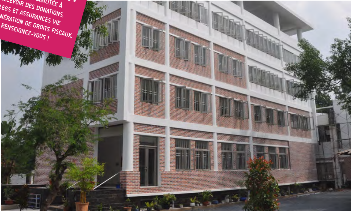
Le bâtiment des filles.

1. SI VOUS VOULEZ SOUTENIR CES PROJETS, ENVOYEZ VOS DONCS À « ALLIANCES INTERNATIONALES » 2. L'AAI EST HABILITÉE À RECEVOIR DES DONATIONS, LEGS ET ASSURANCES VIE EN EXONÉRATION DE DROITS FISCAUX. RENSEIGNEZ-VOUS !