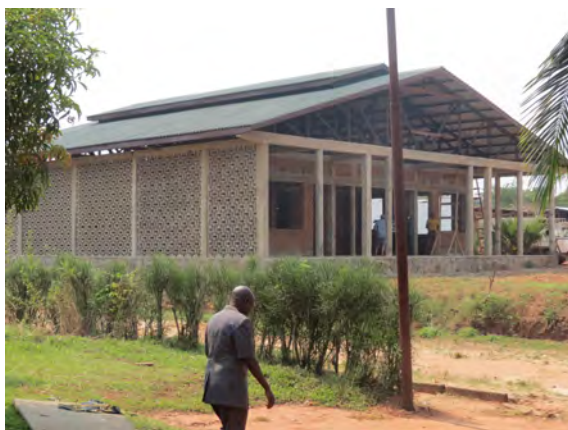
Le centre ophtalmologique.