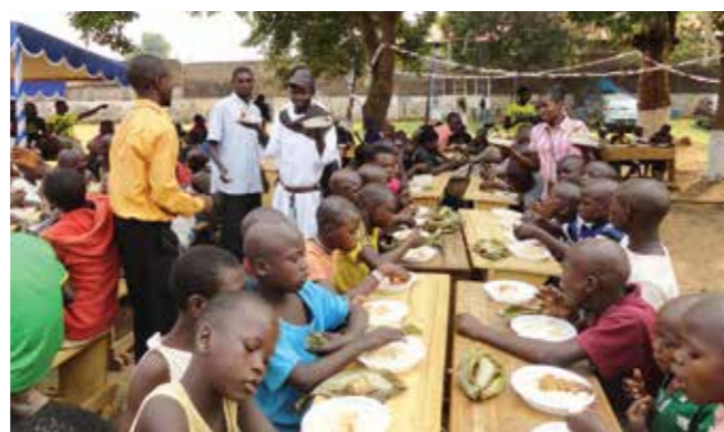
à Bangui : repas pour les enfants du quartier ↑ travaux d'adduction d'eau ↓