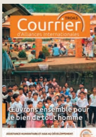
Réfugiés à Bangui en 2014. Enfants vietnamiens du centre de Tan Thong